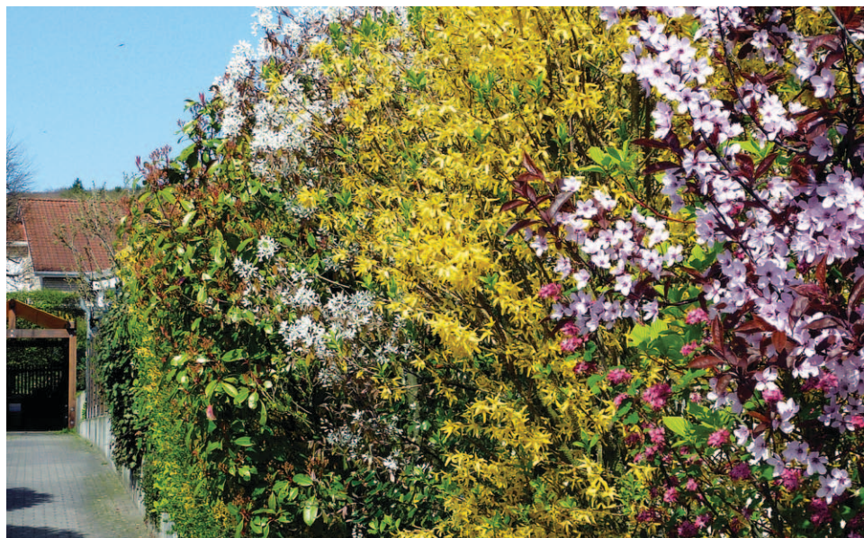
Für einreihige Blühhecken sind Gehölze, wie z. B. (v. r.) Blutkirschen ( Prunus cerasifera 'Nigra'), Forsythien ( Forsythia x intermedia ) und Felsenbirnen ( Amelanchier ), geeignet

Viele Tiere, wie z. B. Singvögel, Igel, Erdkröten, Spitzmäuse oder Laufkäfer, finden in einer solchen Hecke einen Lebensraum. Diese ökologische Funktion wird gefördert, wenn Sie vor allem heimische Wildsträucherarten wie Schlehe, Wildrosen, Schneeball, Hartriegel, Holunder und Weißdorn verwenden.