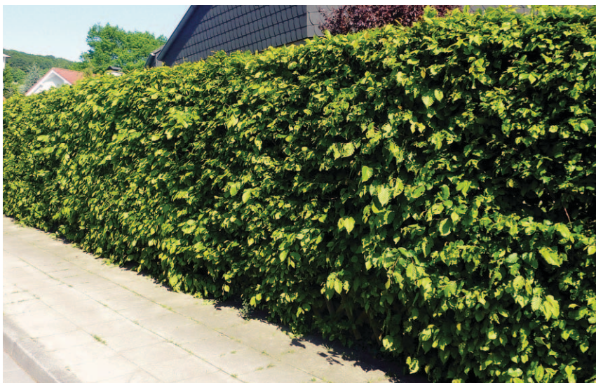
Ideale Abgrenzung für Hausgärten: geformte Hecken aus Hainbuche ( Carpinus betulus )

Um kleinere Gärten zum Nachbargrundstück oder zu einer Straße hin abzugrenzen, bietet es sich an, eine Reihe niedriger Blütensträucher zu pflanzen. Hierfür verwendet man sommergrüne Laubsträucher, wie z.B. Deutzie, Forsythie oder Wildro-